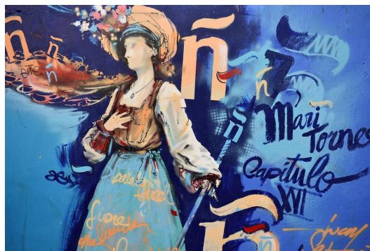
Imagen de la portada de Temas del Quijote N.º 0

Maritornes , una de las mujeres que aparecen en la novela de Miguel de Cervantes ' Las aventuras del ingenioso hidalgo don Quijote de la Mancha ', en un Graffiti artístico dedicado a las ' Mujeres del Quijote ', elaborado por los participantes del proyecto de inclusión artística ' Valorarte ' de Laborvalía, en colaboración con La Fabrica, el grafitero Rufo Milfuegos, y la Concejalía de Medio Ambiente del Ayuntamiento de Ciudad Real.